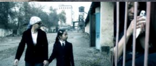
Фрагмент видеоинсталляции «Целующиеся тотемы»

На Алме: платье, накидка, заколка-бант (на руке), все John Rocha; леггинсы-галифе, Antonio Marras; носки и туфли – собственность стилиста