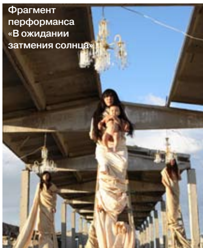
Фрагмент перформанса «В ожидании затмения солнца»