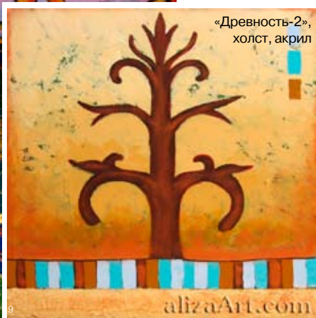
«Древность-2», холст, акрил