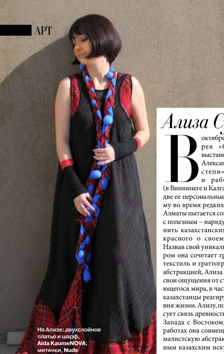
На Ализе: двухслойное платье и шарф, Aida KaumeNOVA; митенки, Nude