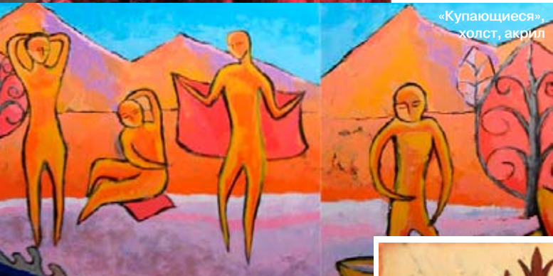
«Купающиеся», холст, акрил

стить традиционный казахский стиль с орнаментами североамериканского индейского племени хайда (на это ее вдохновили работы канадского художника Дэна Доминго, который использует индейскую символику). «Главное, – убеждена Ализа, – сделать все так, чтобы привычные к определенным художественным стандартам люди не были шокированы чрезмерной экзотикой работ. Нужно убедить зрителя, что все эти вещи могут органично и красиво сосуществовать». Екатерина Дзвоник